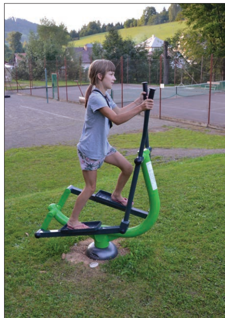
Elipsovité zařízení XC - 05

Uchopte rukojeť a postavte se na pedály, upravte Vaše těžiště a pohybujte nohama střídavě vpřed a vzad. Nohy vždy střídejte a nepohybujte oběma nohama ve stejném