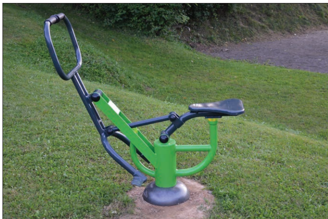
Jezdecké zařízení XC – 08

Věříme, že nově instalované zařízení nám budou dlouho a dobře sloužit. Pro odpočinek nebo pohodlí doprovodu cvičenců jsou u cvičebních strojů umístěny i dvě nové pohodlné lavičky.