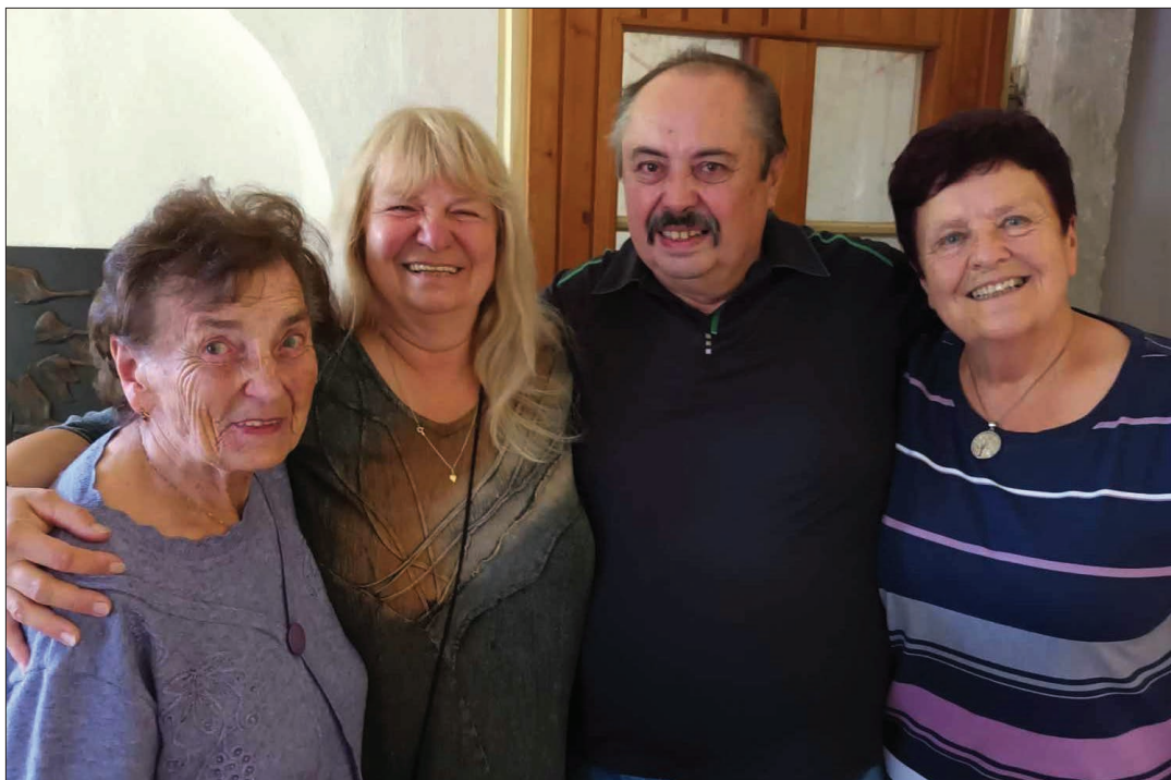
SPOZ a Černohousovi