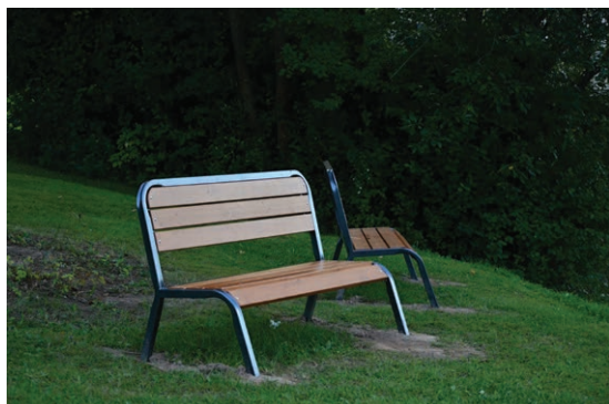
Podklady zpracoval Aleš Nepustil