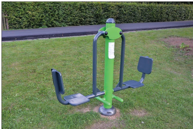
Šlapací zařízení XC - 04

Doporučujeme 3 série po 12 cvicích s přestávkou mezi sériemi dle fyzického stavu cvičící osoby. Budete-li cítit jakoukoliv bolest, cvičení přerušete.