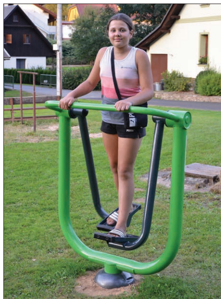
Procvičování chůze XC – 07

Doporučujeme 3 série po 10 - 15 cvičích s minutovou přestávkou mezi sériemi a dále podle fyzického stavu cvičící osoby. Budete-li cítit jakoukoliv bolest, cvičení přerušete.