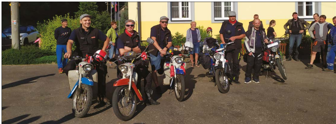
Jawa jede k moři - začátek cesty / odjezd