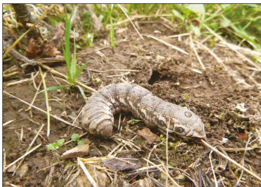
Lišaj pupalkový