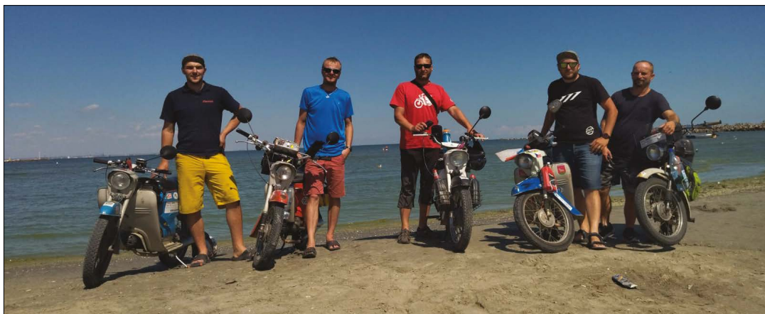
Jawa jede k moři - cíl cesty / moře...

Konkrétní plán nemáme, ale zmiňovali jsme Finsko, Švédsko a Island. Tak uvidíme.