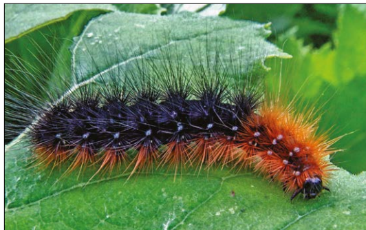
Prástevník medvědí

Další návštěvník, jenž mě moc potěšil, nepatří k lišajovitým, ale přástevníkovitým. Na naši louku přiletěl prástevník medvědí ( Arctia caja ). Společné s lišajovitými má to, že je noční motýl. Uvádí se, že je častý na vlhkých loukách v podhůří, ale musím se přiznat, že ačkoliv trávím venku dost času, naposledy jsem v Těchoníně přástevníka medvědího viděla tak před třiceti lety. Motýl je dost velký, se zavalitým tělem a hodně chlupatou hrudí, za což si vysloužil přívlastek medvědí. Na jeho předních křídlech jsou na krémovém podkladu rozmístěny hnědé skvrny různých tvarů, zadní křídla jsou mnohem výraznější – na tmavě červeném, někdy až oranžovém podkladu jsou skvrny temně kovově modré s černým okrajem. Právě ono křiklavé zbarvení zadních křídel pomáhá motýlovi proti predátorům, při napadení je roztáhne a útočník se buď zalekne, nebo přástevník získá alespoň čas na únik. Dočetla jsem se, že tito motýli (ale i housenky) mají přírodou naděleny další možnosti obrany. Jejich tělní tekutiny obsahují řadu jedovatých a dráždivých látek, takže většina predátorů není schopna je požít. A ještě, což vás asi stejně jako mě překvapí, motýli i housenky vydávají zvláštní zvuky v rozsahu vlnové délky echolokačních signálů netopýrů, kterými je ruší, nebo vytvářejí falešné ozvěny. Matka příroda je prostě dokonalá... Housenky přástevníka medvědího mají dlouhé rezavé a černé chlupy,