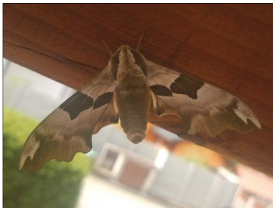
Lišaj lipový

Lišaj pupalkový ( Proserpinus proserpina ) nemá sice další pojmenování, ale o to je vzácnější. Z čeledi lišajovitých patří k nejmenším zástupcům, ovšem v ČR je chráněn zákonem jako silně ohrožený druh. Délka jeho předního křídla je 18–26 mm, přední křídla mají základní barvu zelenošedou, popřípadě zelenohnědou, typická výrazná střední páska na nich probíhá kolmo a v ní se černá středová skvrna. Zadní křídla jsou žlutá s tmavým okrajem. Housenka lišaje pupalkového má hnědou, vzácně zelenou barvu, nemá však na konci těla růžek jako ostatní lišajové, ale pouze žlutě zbarvený výstupek. Živí se na vrbkách, kyprejích, vrbovkách, a jak jméno napovídá, na pupalce dvouleté (ta se teď v Těchoníně rozšířila při trati a u cest). Motýli rádi sají nektar i z šalvěje a hadince. Housenky i motýli jsou aktivní hlavně po soumraku. Kukla přezimuje ve zbytcích rostlin v zemi. Motýli se u nás proletují od května do června. Když je pozorujete, jak se přímočaře pohybují nahoru, dolů, náhle se zastaví nad květem, připomínají maličký vrtulník.