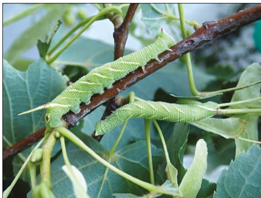
Lišaj lipový

Nejprve se zmíním o lišaji lipovém ( Mimas tiliae ), jenž má i starší pojmenování zubokřídlec lipový. Patří u nás k těm častějším, ne ovšem v Těchoníně. Mezi lišaji je středně velký, s délkou předního křídla 36–40 mm. Jeho základní barva je zelenošedá, i když je hodně variabilní. Středem předních křídel vede tmavší pás, zpravidla hnědé barvy. Vajíčka i housenky mají barvu zelenou. Housenkám trčí na konci těla pro většinu lišajů typický růžek, u lipového namodralý. Žijí hlavně na lípách, ale i na jiných listnácích. Kuklu mají černohnědou, ta přezimuje v zemi. Motýly můžeme spatřit od května do července, v teplých létech déle. Stává se, že večer naletují na světla.