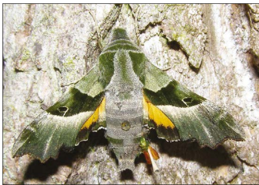
Lišaj pupalkový

Další návštěvník, jenž mě moc potěšil, nepatří k lišajovitým, ale přástevníkovitým. Na naši louku přiletěl prástevník medvědí ( Arctia caja ). Společné s lišajovitými má to, že je noční motýl. Uvádí se, že je častý na vlhkých loukách v podhůří, ale musím se přiznat, že ačkoliv trávím venku dost času, naposledy jsem v Těchoníně přástevníka medvědího viděla tak před třiceti lety. Motýl je dost velký, se zavalitým tělem a hodně chlupatou hrudí, za což si vysloužil přívlastek medvědí. Na jeho předních křídlech jsou na krémovém podkladu rozmístěny hnědé skvrny různých tvarů, zadní křídla jsou mnohem výraznější – na tmavě červeném, někdy až oranžovém podkladu jsou skvrny temně kovově modré s černým okrajem. Právě ono křiklavé zbarvení zadních křídel pomáhá motýlovi proti predátorům, při napadení je roztáhne a útočník se buď zalekne, nebo přástevník získá alespoň čas na únik. Dočetla jsem se, že tito motýli (ale i housenky) mají přírodou naděleny další možnosti obrany. Jejich tělní tekutiny obsahují řadu jedovatých a dráždivých látek, takže většina predátorů není schopna je požít. A ještě, což vás asi stejně jako mě překvapí, motýli i housenky vydávají zvláštní zvuky v rozsahu vlnové délky echolokačních signálů netopýrů, kterými je ruší, nebo vytvářejí falešné ozvěny. Matka příroda je prostě dokonalá... Housenky přástevníka medvědího mají dlouhé rezavé a černé chlupy,