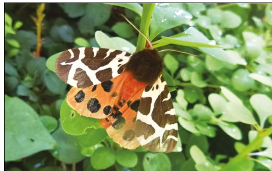
Prástevník medvědí

pod nimiž prosvítají bílé bradavky. V nebezpečí se stočí do klubíčka a většinou spadnou z listu na zem. Ještě jedna zajímavost. Narodí se od motýlů, kteří sají nektar květin, housenky požívají často i jedovaté rostliny, jejichž toxiny si pro obranu uchovávají v těle. U přástevníka medvědího přezimují housenky v polodorostlé podobě, kuklí se až dovyvinuté na jaře. Dospělci létají v červnu až srpnu. Na závěr dodám, že tento noční motýl je přitahován světlem, ale prý až kolem půlnoci a většinou ve skupině s dalšími jedinci. Proč právě v tuto dobu, to dosud vědci nevědí... Doufám, že tito letošní návštěvníci u nás zůstanou natrvalo.